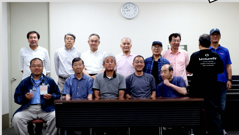
6月定例会参加者の皆さん

驚いた! 顧客幼稚園で「先生が撮影した映像」を使用することになり、そのクオリティの高さに!!! ビューファインダーのない数万円のカメラでも使い方によっては「侮れない!」で、なんか興味津々です。(T)