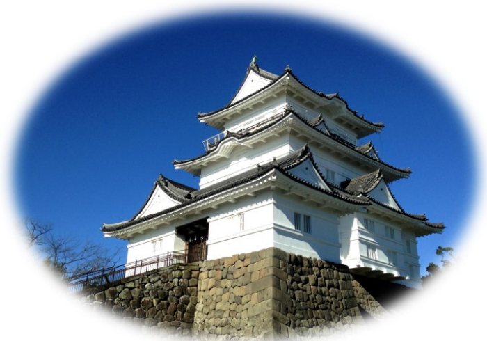
2017年、元旦快晴の小田原城 (2016年改修。展示物も一新、中々見応えあり。一度ぜひお出かけください)

2017年はさて、会報にビデオ屋稼業録とでも称して、参考までに自分の実態を可能な限り投稿して見ようかと考えている。そういう訳で今年もよろしくお願ひします。